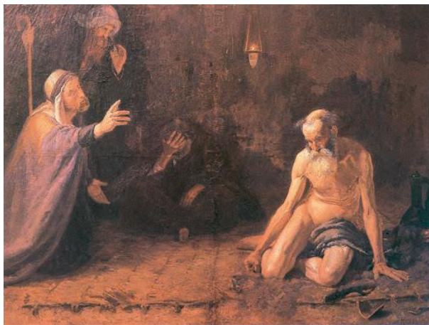
Kunffy Lajos: Jób, 1896, Kunffy Lajos Emlékmúzeum, Somogytúr

Kérjük Urunk, hogy állítsd meg ezt a csapást és hozz békét a világra! Kérünk, hogy megtanuljunk, amit Te akarsz nekünk tanítani! Atyánk, legyen meg a Te akaratod!